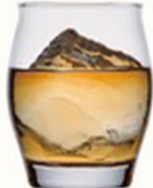
ハーフロック HALF ROCK