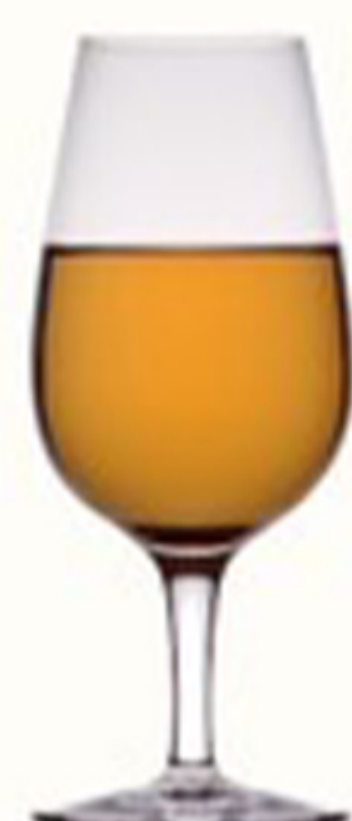
トワイソップ TWICE UP