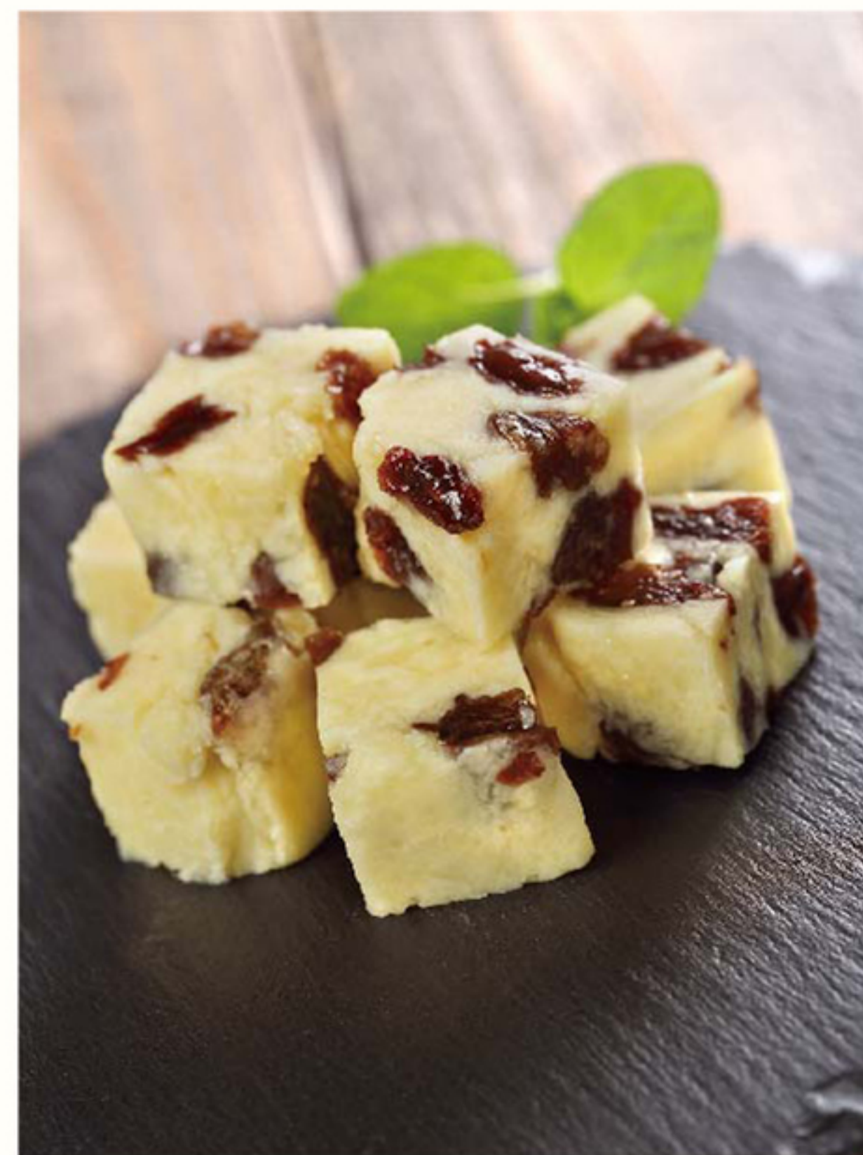
プラムレーズンバター 660円 じっくりと梅酒に漬けた自家製のレーズンバター