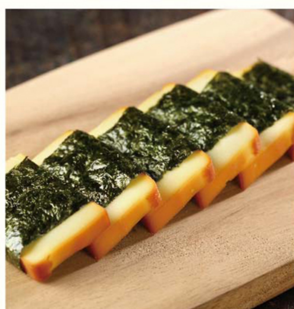
スモークチーズの磯辺巻き