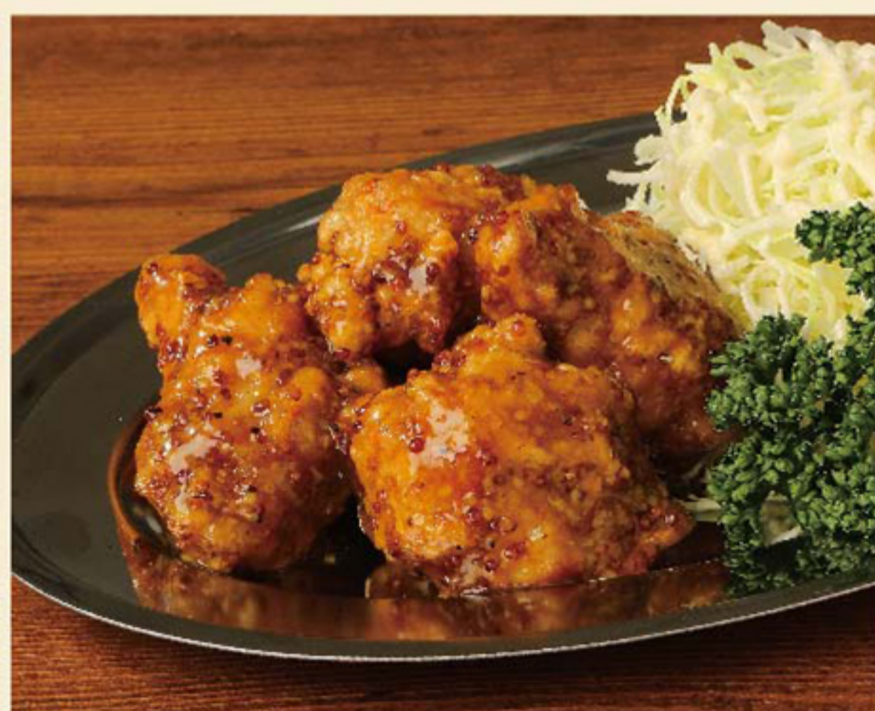
ハニーバターマスタード