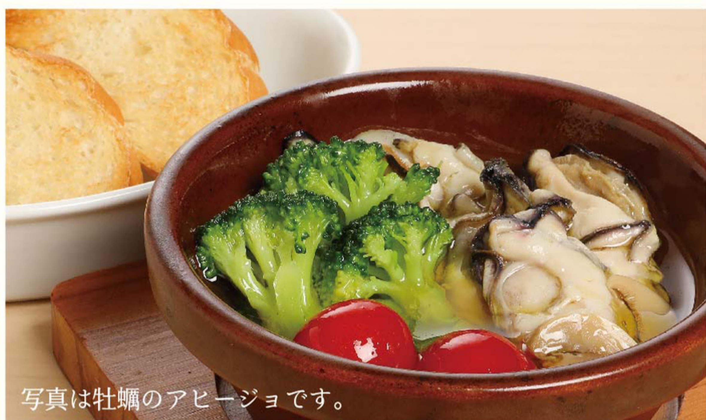
写真は牡蠣のアヒージョです。