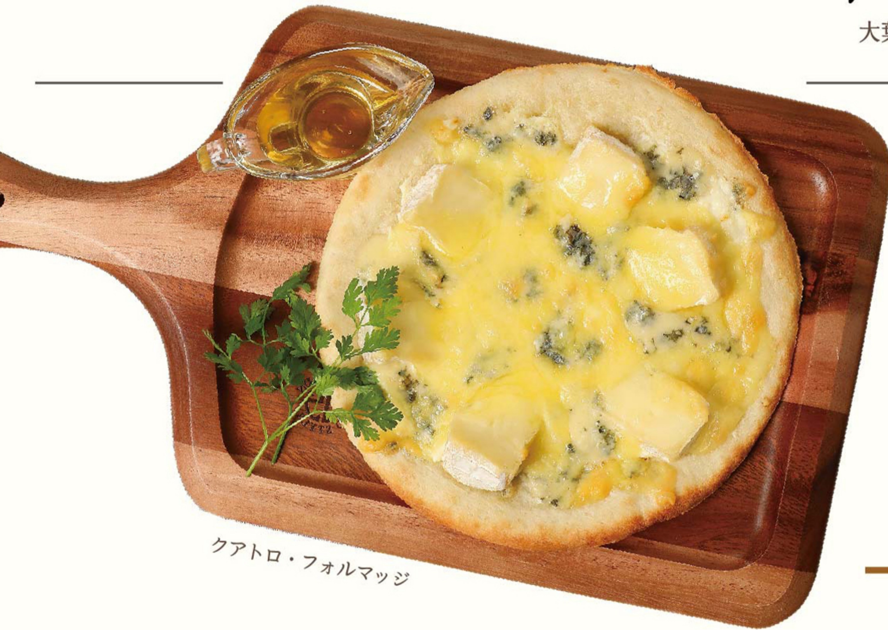
クアトロ・フォルマッジ