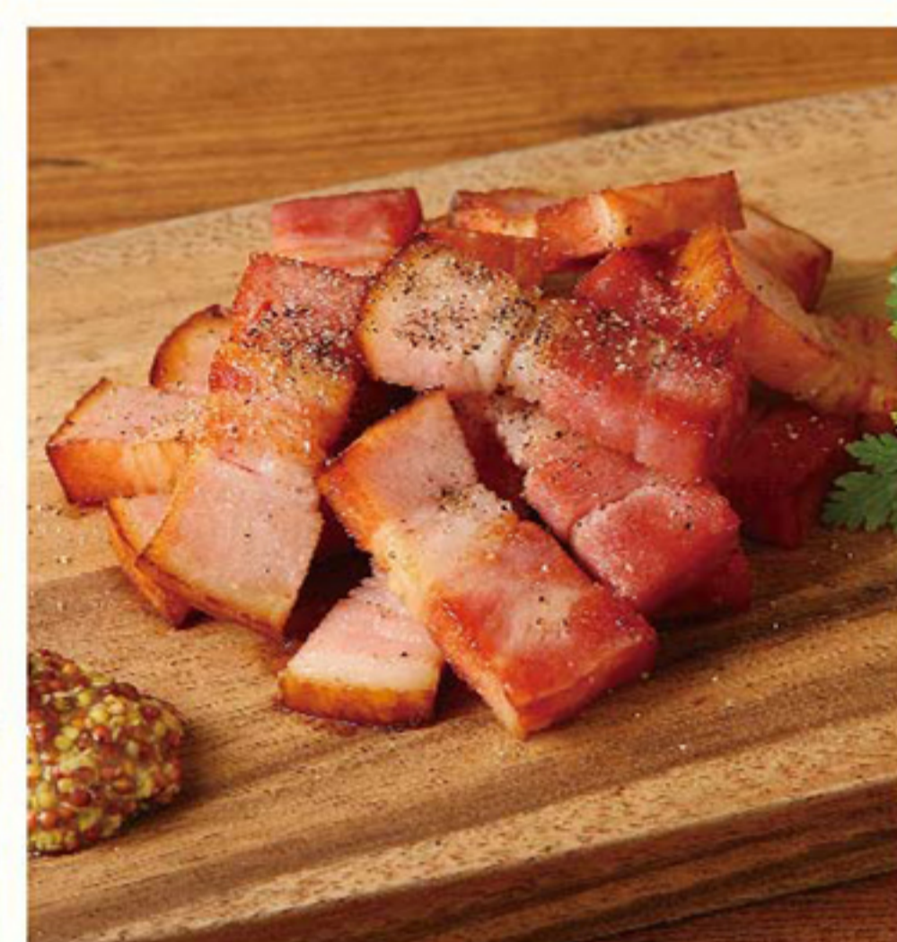
自家製ベーコンのグリル