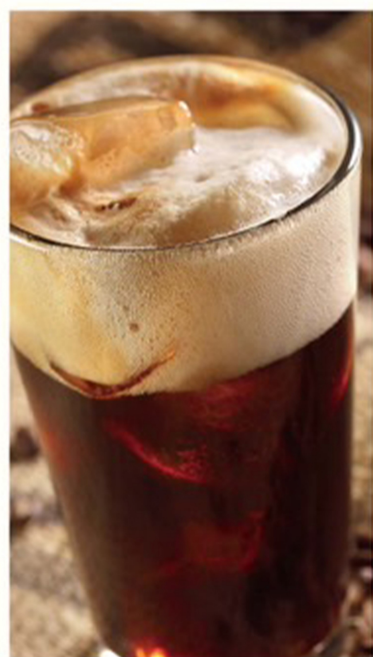
珈琲ドリップハイボール

ポトリポトリと一滴ずつ12時間以上かけて抽出 専用機材で水出しならぬ“ウイスキー出し”