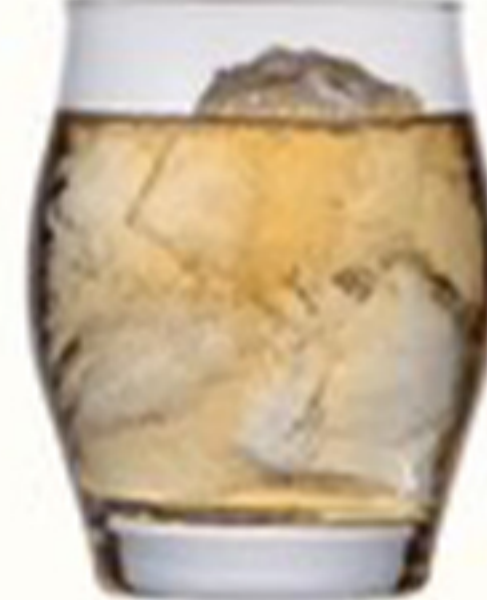
水割り WHISKY & WATER