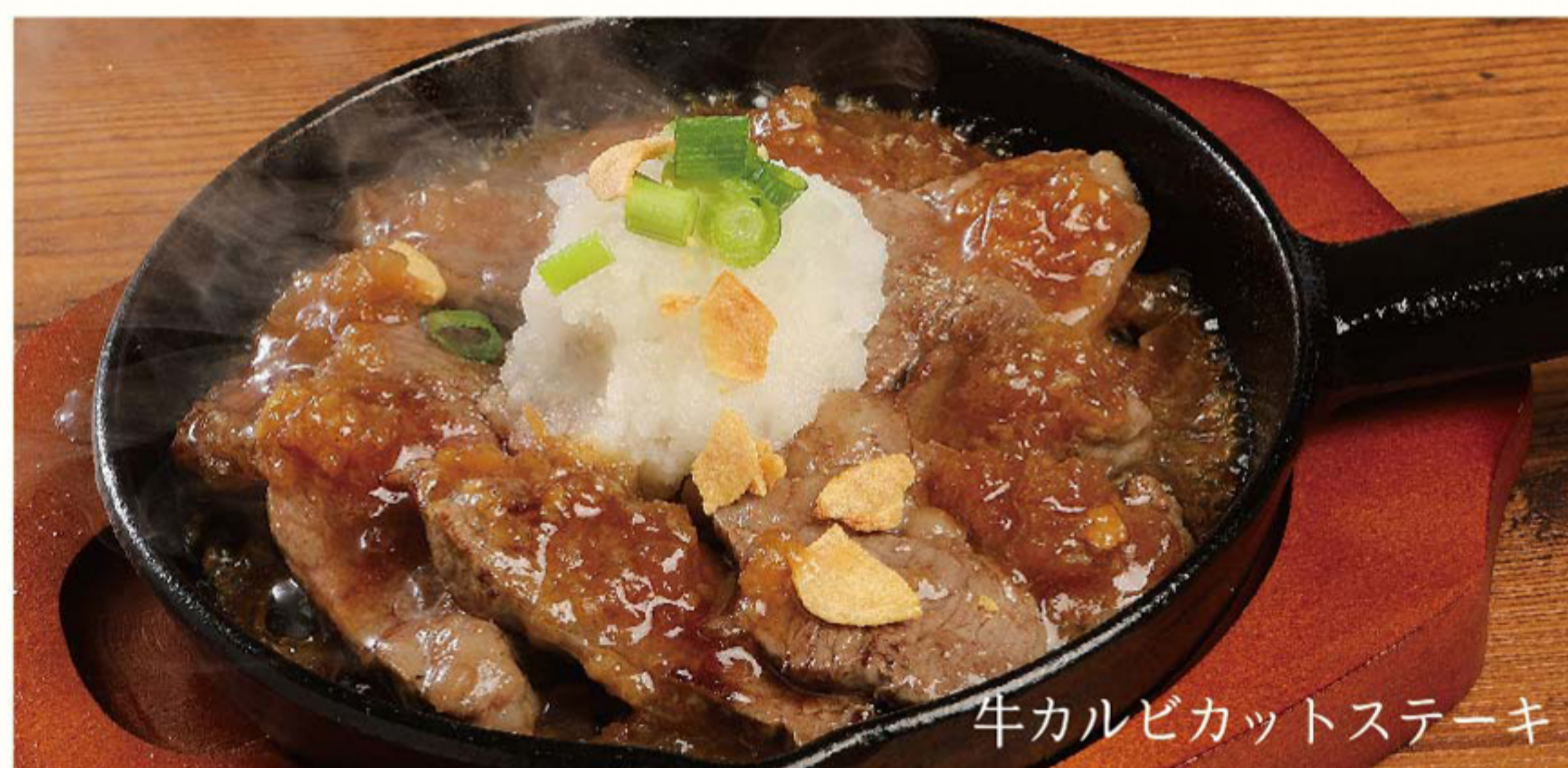
牛カルビカットステーキ