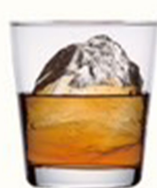
オンザロック ON THE ROCKS