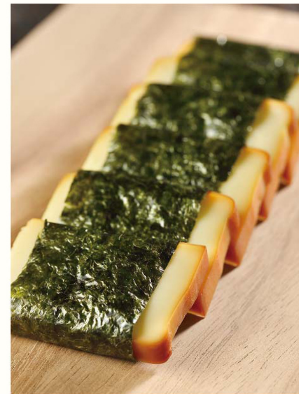
スモークチーズの磯辺巻き 550円 軽く温めたチーズを海苔で巻きました。