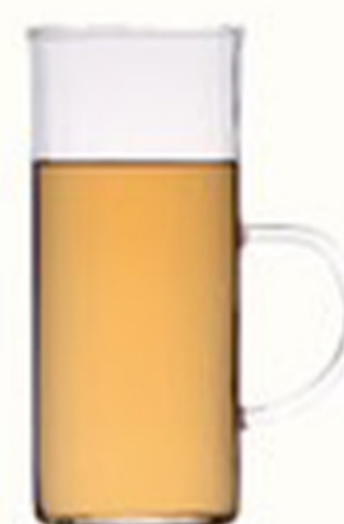
ホットウイスキー HOT WHISKY