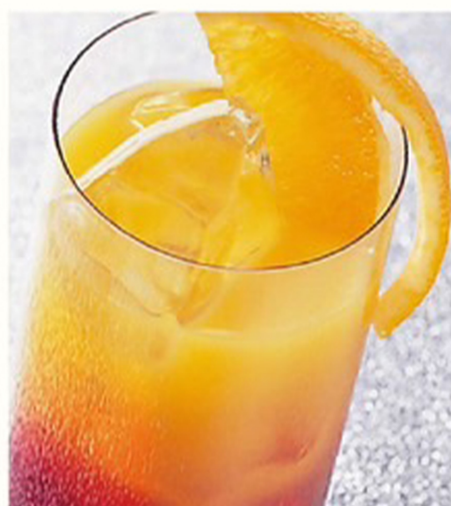
プレミアムカシスオレンジ