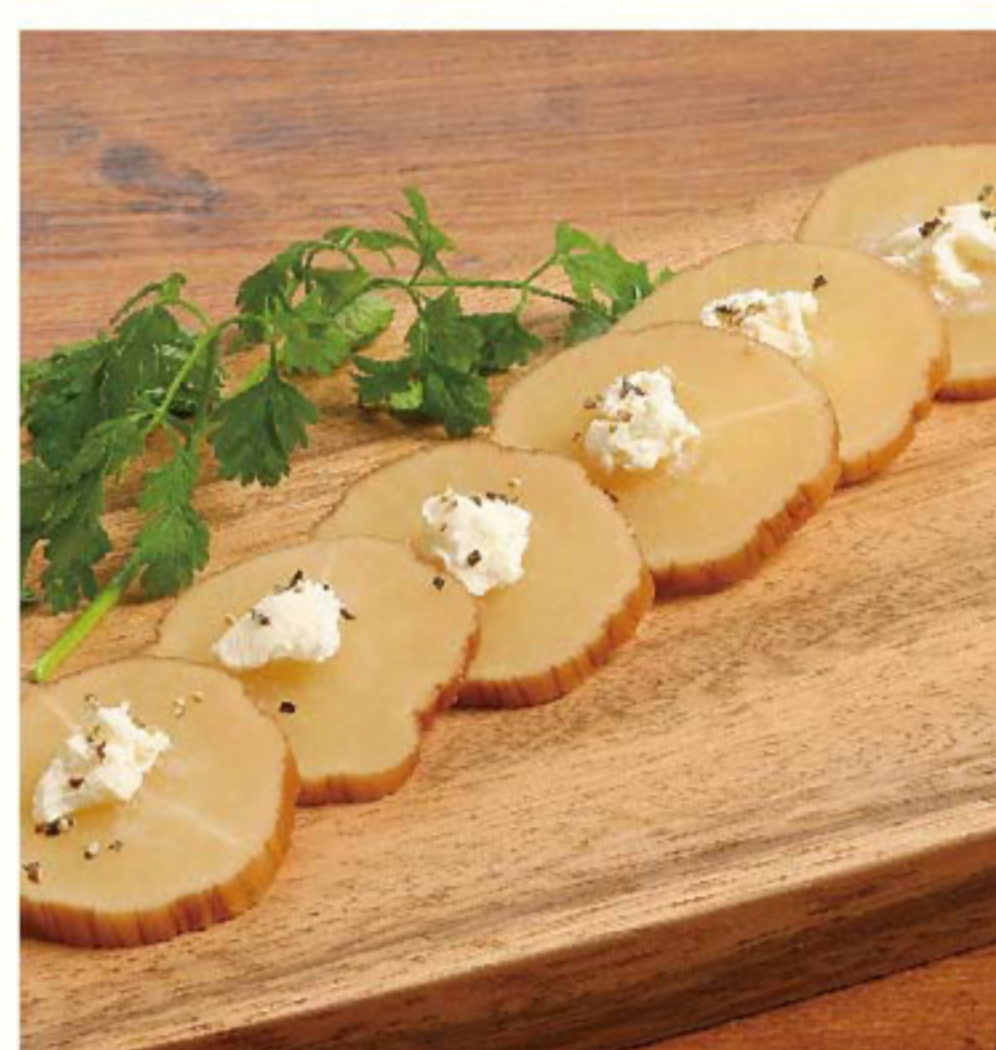
いぶり沢庵とクリームチーズ