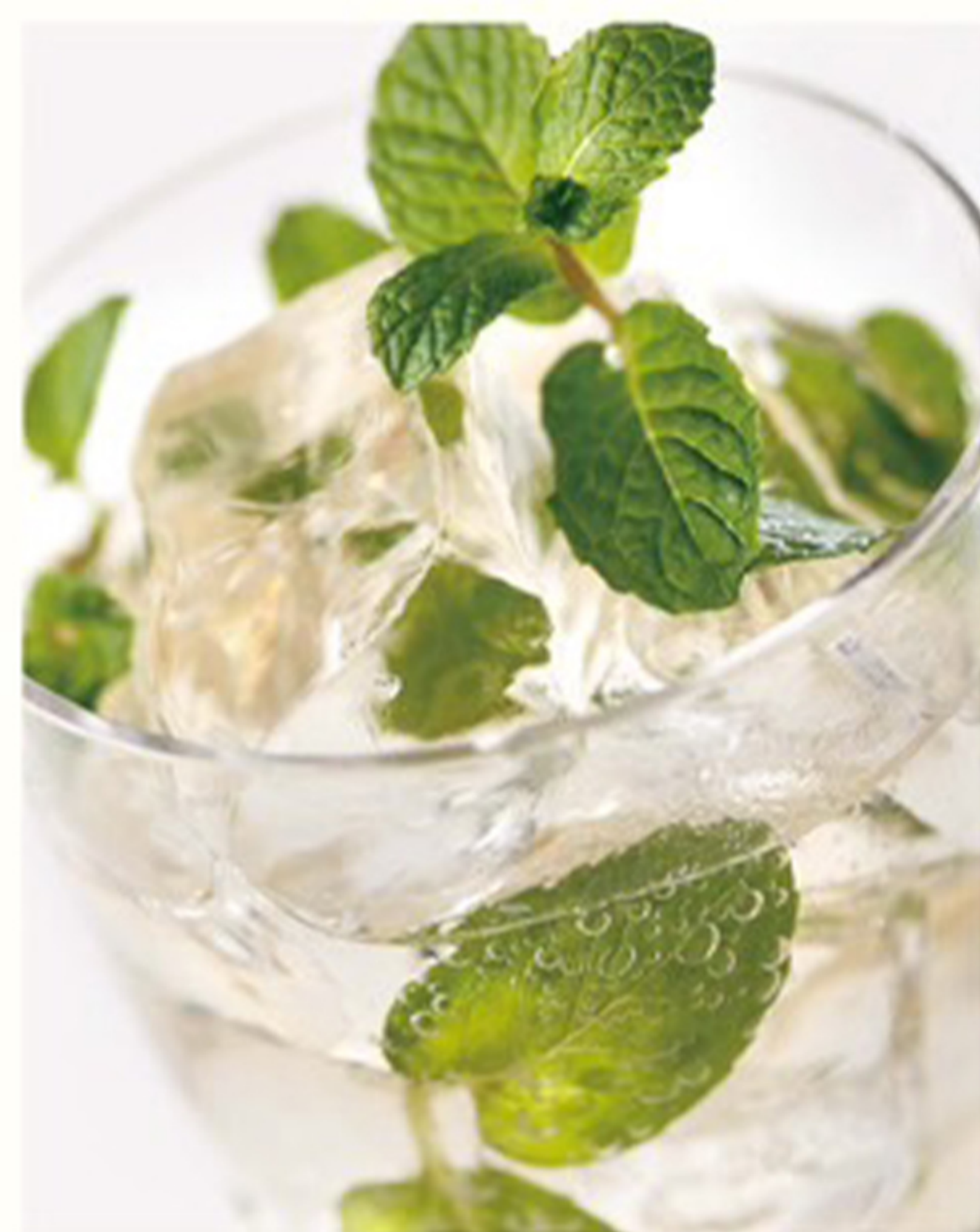
カナディアンモヒート

天然水とフレッシュレモンジュースにバーボンウイスキーを加えたレモネード。女性におすすめのカクテルです。