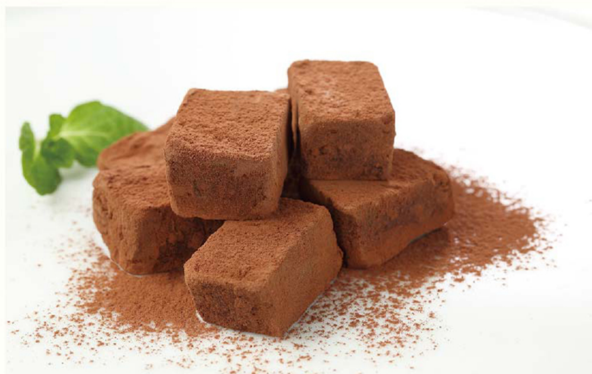
自家製 生チョコレート 720円 メーカーズマークとオレンジピールを練り込んだ自家製生チョコ