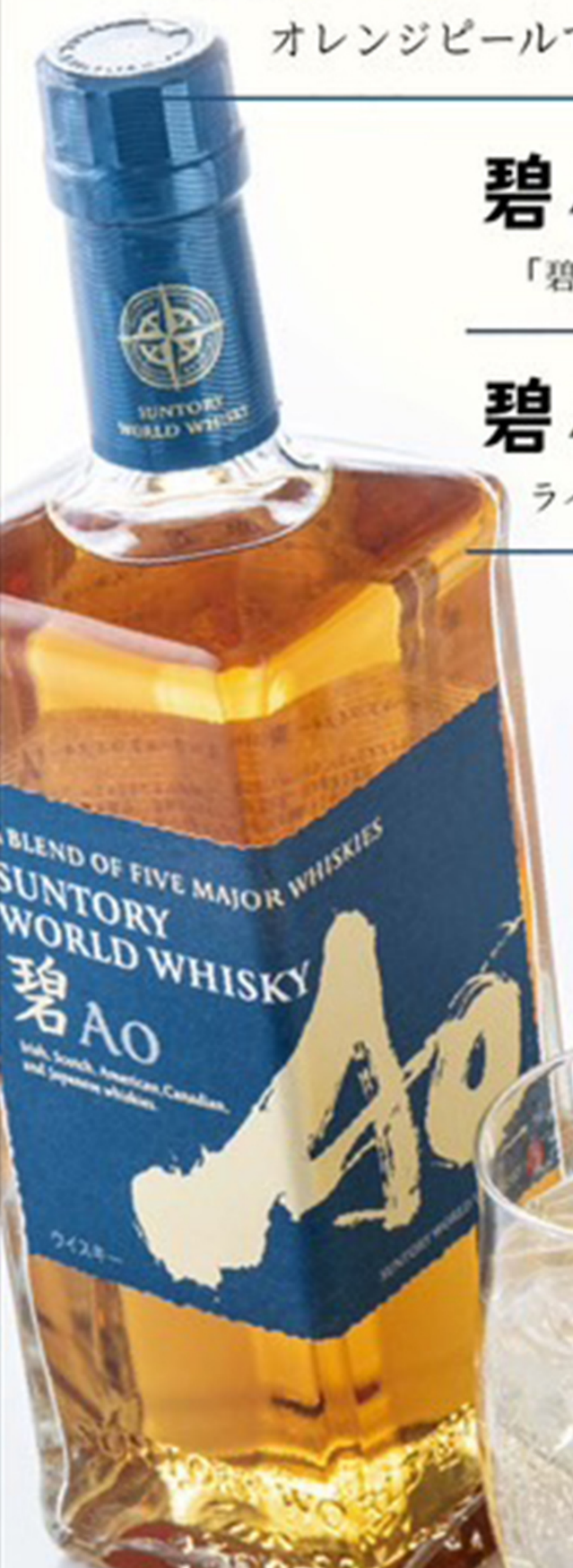
碧 Ao シトラスハイボール