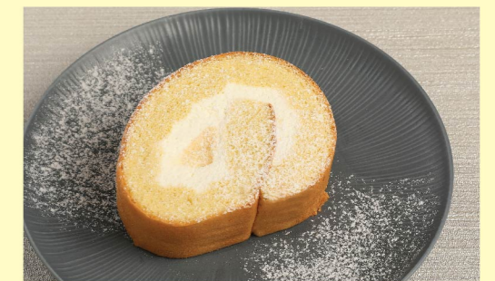
⑳ ロールケーキ ¥660 Roll cake