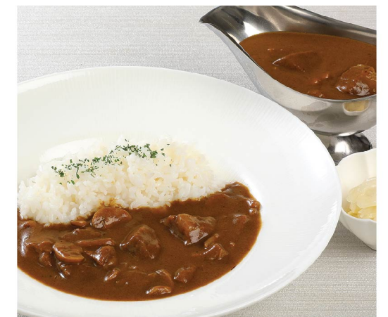
⑦ ビーフカレー ¥1,430 Beef curry