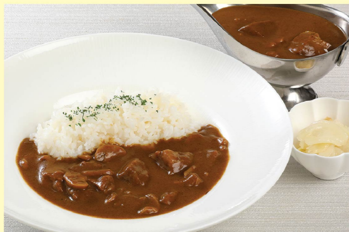
⑦ ビーフカレー ¥1,430 Beef curry