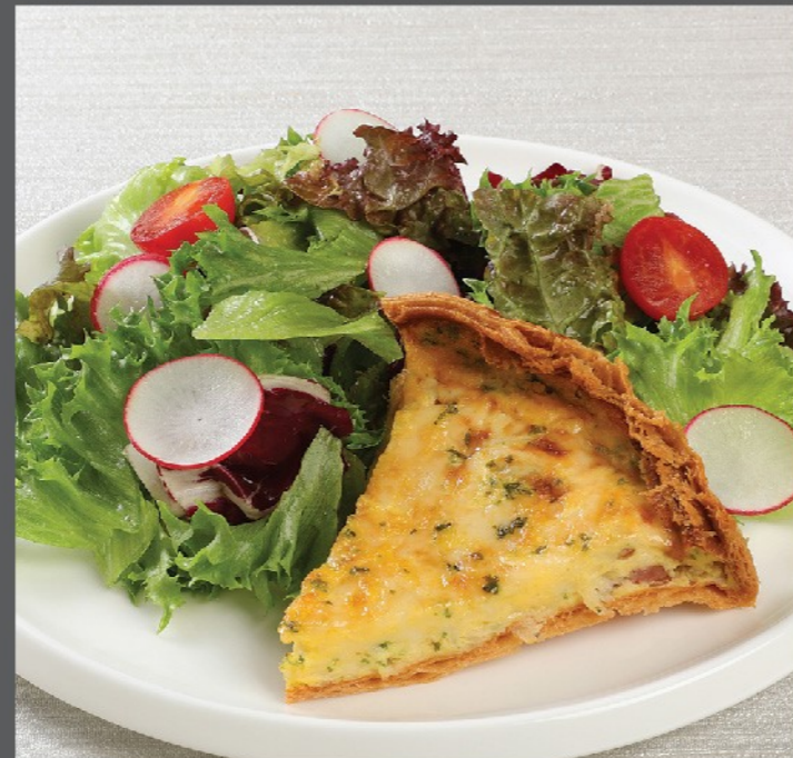
⑧ キッシュプレート ¥1,200 Quiche plate