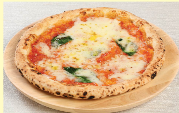
⑫ ピッツァ クワトロフォルマッジ ¥1,320 Pizza Quattro Formaggi