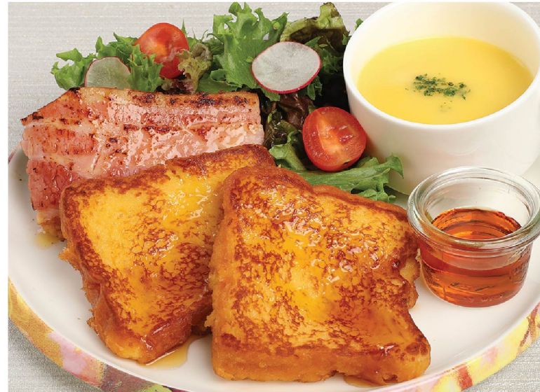
① ブリオッシュフレンチトーストプレート Brioche french toast plate ¥1,320