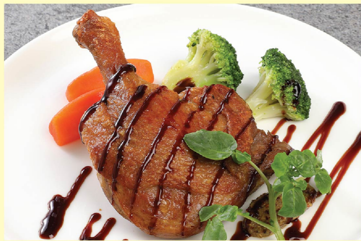
⑤ 合鴨コンフィ ¥3,080 Duck confit