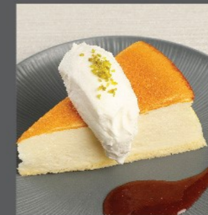
⑲ チーズケーキ Cheesecake ¥720