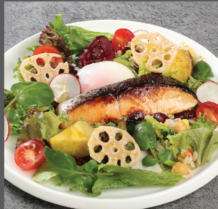
⑥ サーモンの京白味噌漬けグリル& グレインズサラダ ¥2,530 Grilled salmon marinated in Kyoto white miso & grains salad