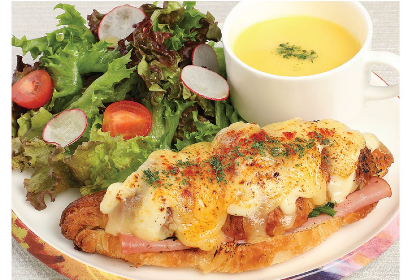
② クロワッサンクロックムッシュプレート Croissant croque monsieur plate ¥1,430