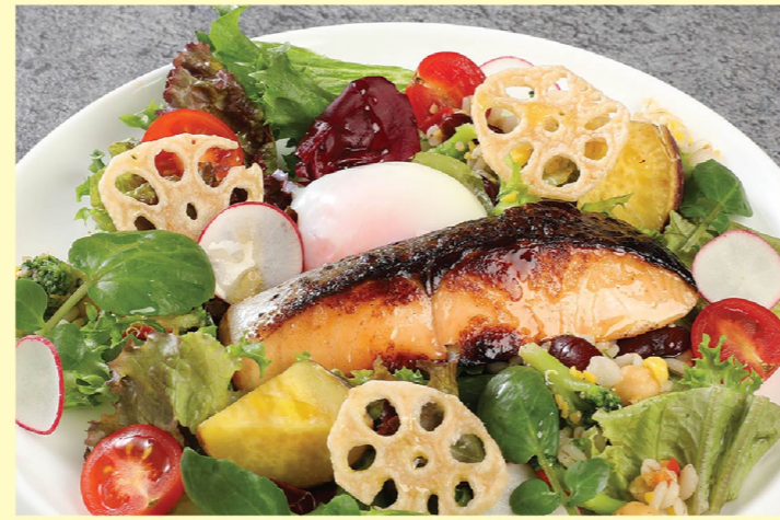
⑥ サーモンの京白味噌漬けグリル & グレイNZサラダ ¥2,530 Grilled salmon marinated in Kyoto white miso & grains salad