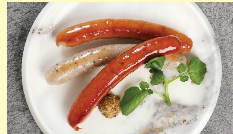
⑱ ソーセージ盛り合わせ ¥880 Assorted sausages