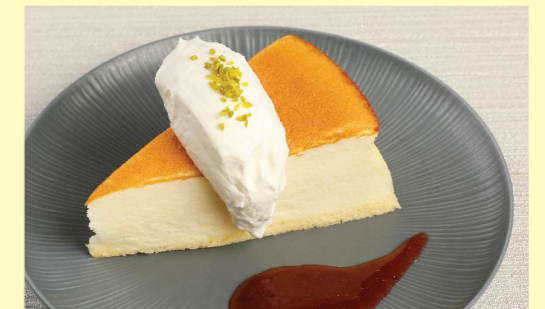
⑲ チーズケーキ ¥720 Cheesecake