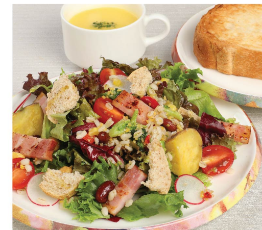
④ 厚切りベーコンとグレインズ ミックスサラダプレート Thick-sliced bacon and mixed grain salad plate ¥1,430