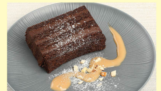
㉑ スフレチョコサンドケーキ ¥720 Soufflé chocolate sandwich cake