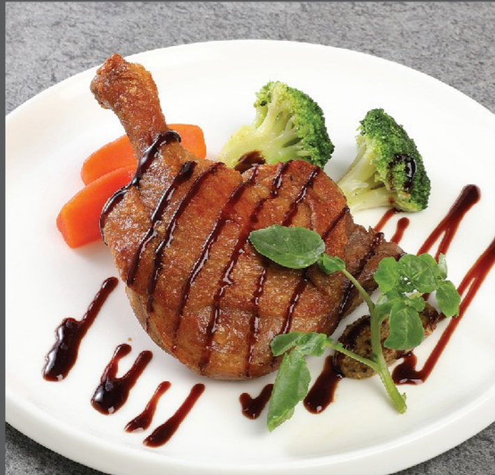
⑤ 合鴨コンフィ ¥3,080 Duck confit