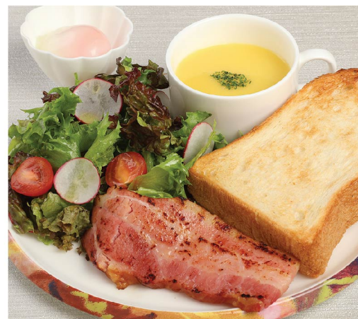
③ トーストプレート ¥980 Toast plate