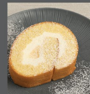
⑳ ロールケーキ Roll cake ¥660