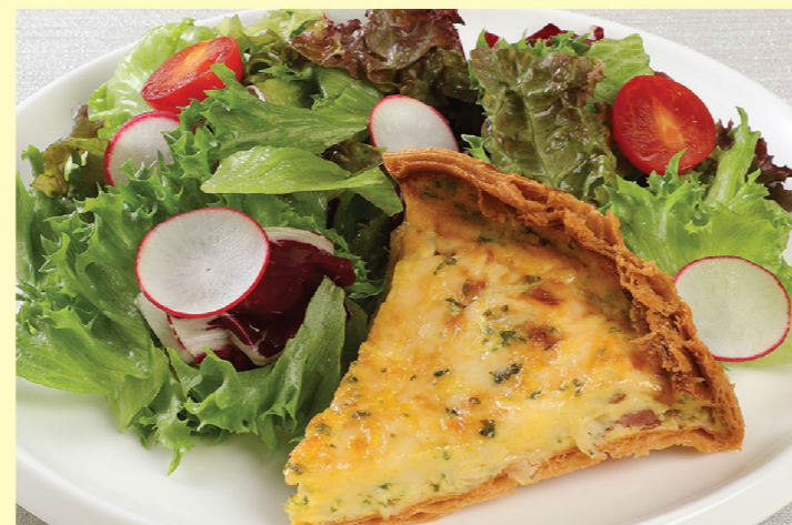
⑧ キッシュプレート ¥1,200 Quiche plate