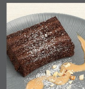
㉑ スフレチョコ サンドケーキ Soufflé chocolate sandwich cake ¥720